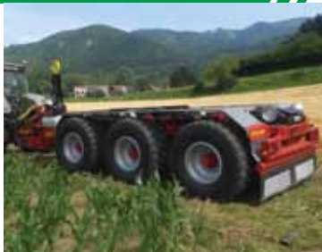
Porte-containers de 1 à 3 essieux.