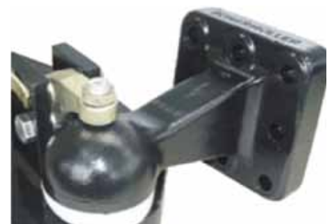
Attelage Scharmüller à calotte sphérique Ø 80 mm.