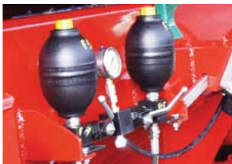
Essieu suiveur forcé avec avec commande hydropneumatique et attelage tournant type Scharmüller.