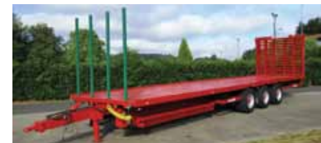
Rampes hydrauliques en option