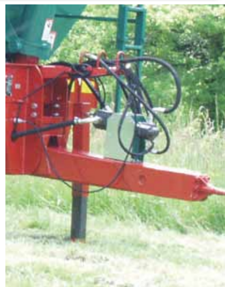
Bennage par moteur hydraulique sur simple effet tracteur et retour libre.