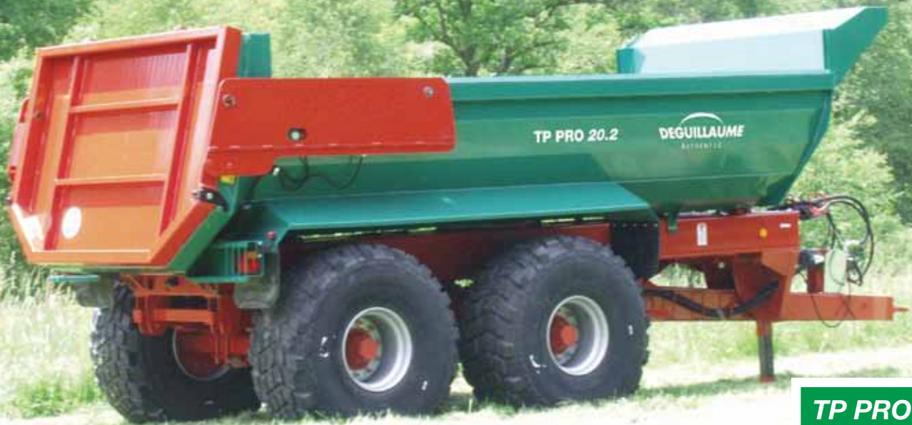
TP PRO 20.2

ROBUSTESSE & POLYVALENCE AU SERVICE DE VOS CHANTIERS TP