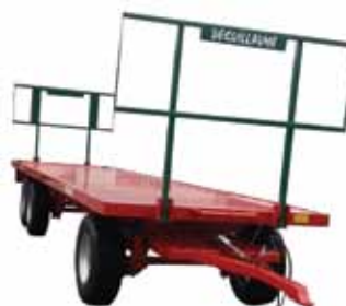
Plateaux 4 ou 6 roues à tourelle ou semi-portés 6 à 12 m.