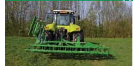
Repliage manuel ou hydraulique.