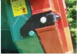
Crochet de verrouillage porte arrière réglable.