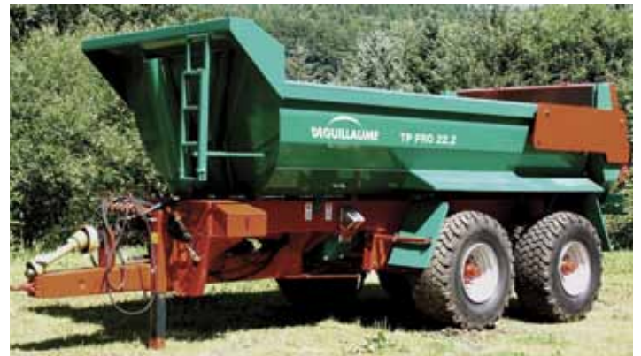
TP PRO 22.2 avec bennage cardan et garde-boues.