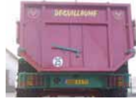
Trappe sur porte arrière.