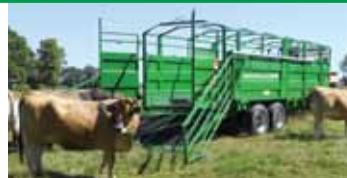
Classique ou pose au sol, pont hydraulique, barrières coulissantes intérieures/extérieures, porte latérale...