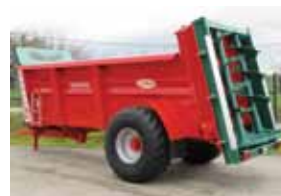
1, 2 ou 3 essieux Vis verticales, table d'épandage, kit compost.