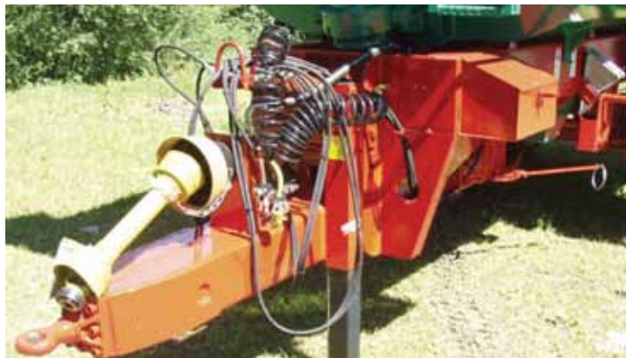
Freinage pneumatique et béquille hydraulique grande course avec clapet piloté.