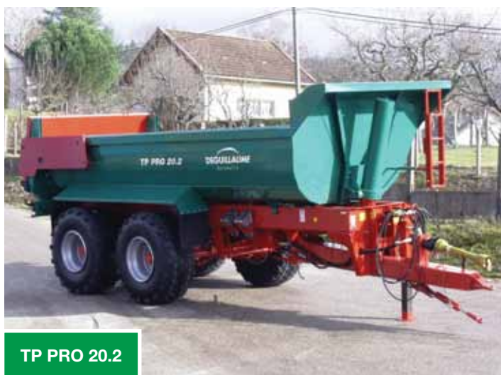
TP PRO 20.2