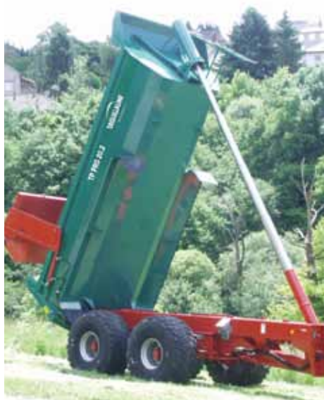
Vérin frontal, basse pression et angle de bennage important, hauteur de chargement diminuée et stabilité accrue.