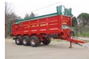
Caisnes étroites ou caisnes larges, Isobus, pesée...