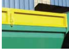
Réhausseurs TP 30 cm.