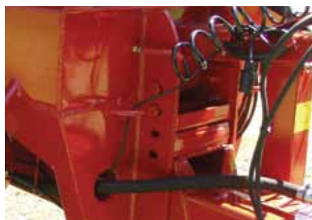
Flèche mono-poutre sur silentbloc caoutchouc.