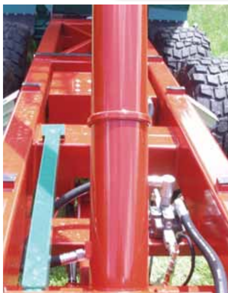
Châssis construction acier (HLE) et vanne de descente rapide sur pilotage double effet tracteur.