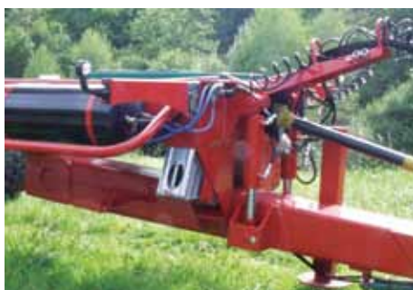
Flèche mono-poutre sur suspension hydropneumatique.