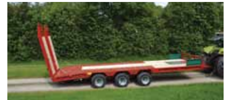
Porte-engins 1, 2 ou 3 essieux.